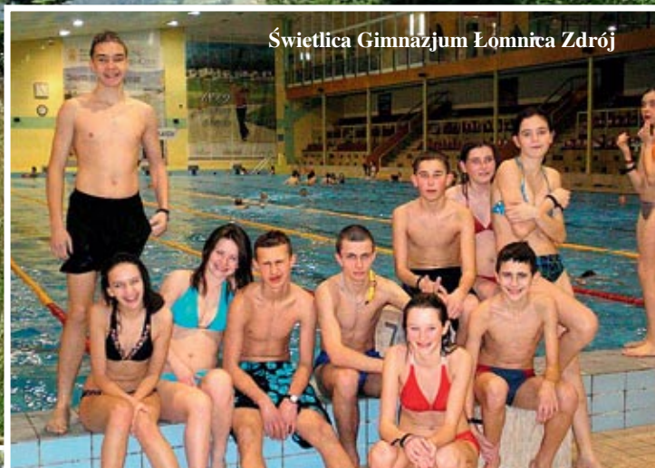
Świetlica Gimnazjum Łomnica Zdrój