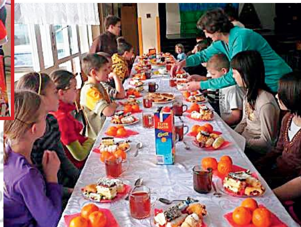
Świetlica Szk.Podst. Piwniczna – Zdrój - urodziny wychowanków

W tle projekt boiska sportowego w Wierchomli.