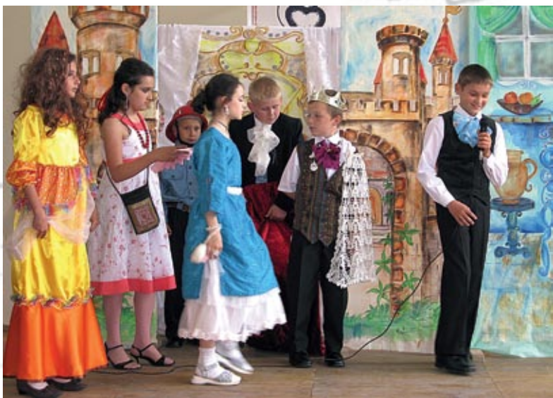
Świetlica Szk.Podst. Łomnica Zdrój - grupa teatralna