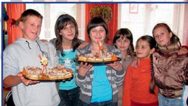
Urodziny w świetlicy Wierchomla