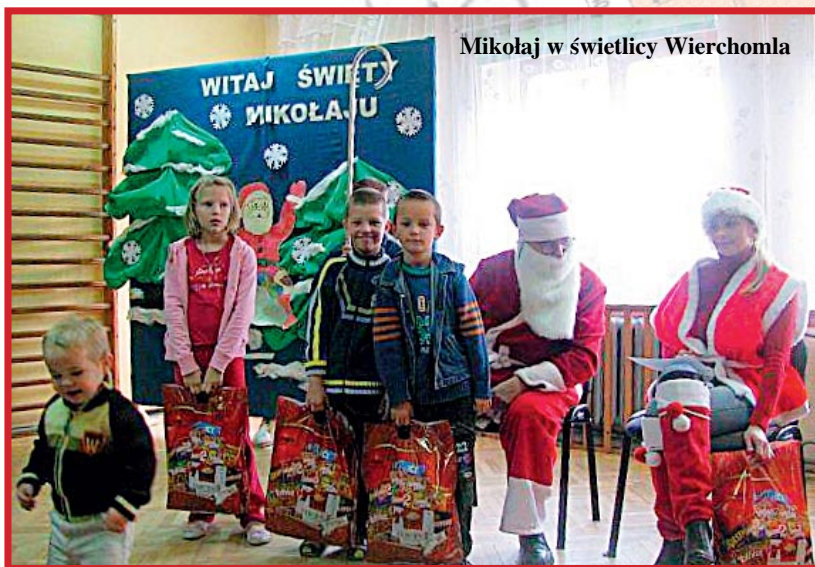
Mikołaj w świetlicy Wierchomla