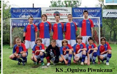
KS „Ogniwo Piwniczna”