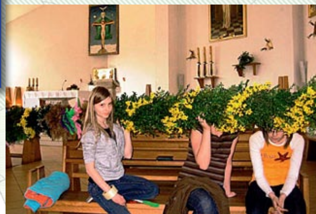
Świetlica Głęboke – palmy Wielkanocne