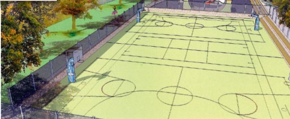
Zagospodarowanie brzegów Popradu - Skatepark